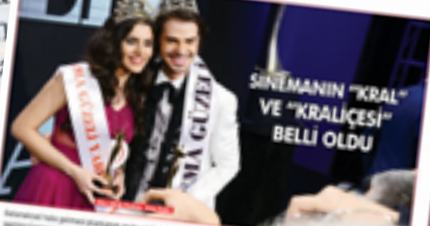
SİNEMANIN "KRAL" VE "KRALİÇESİ" BELLI OLDU